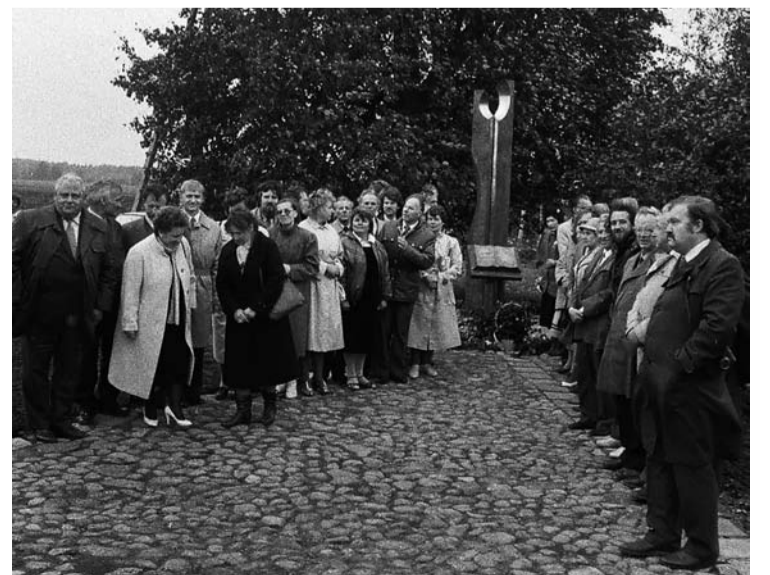
Paminklo Konstantinui Sirvydai atidengimo iškilmės Sirvydų kaime.

Dar ačiūdie, kad iš Dabužių, - iš tėviškės – ateis arkliai. Su saule rytoj galėsiu judintis į kelią. Tik viržių mėnesio pabaigoje turėsiu grįžti... mokslo metų pradžiai pamokslą pasakyti. (...) Raštai, Vilnius 1982, III tomas, p. 89 (Nukelta į 8 psl.)